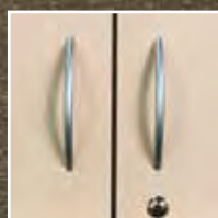
Bügelgriff matt verchromt