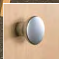
Möbeknopf matt verchromt