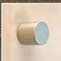
Griffknopf matt vernickelt