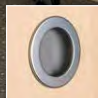
Muschelgriff rund matt verchromt