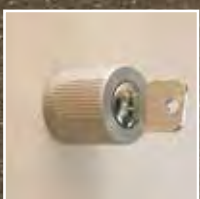
Drehzylinder matt vernickelt